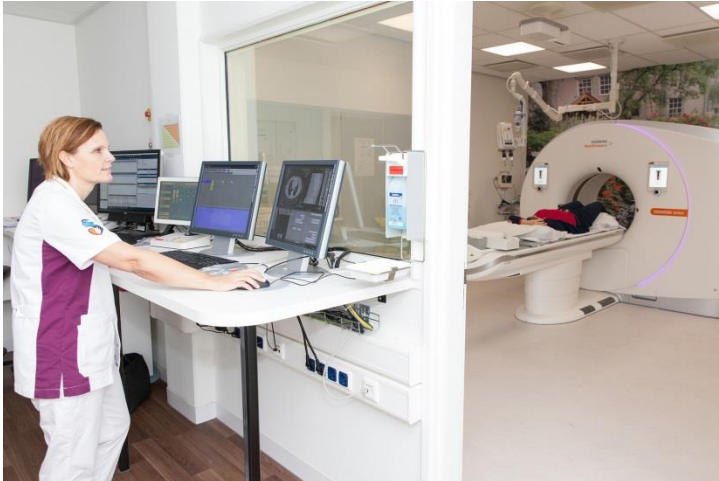
Afbeelding 2: De laborant staat in de ruimte naast de CT-kamer.

Bij sommige CT-onderzoeken van de longen of de buik vraagt de laborant u om 5 tot 20 seconden uw adem in te houden. Tijdens het onderzoek is de laborant in de ruimte naast de CT-kamer. De laborant kan u zien door een raam en met u praten via een intercom (zie afbeelding 2).