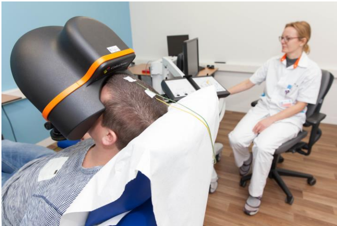
Afbeelding 3: De halfronde bol is voor uw gezicht geplaatst.

De laborant plaatst een halfronde bol voor uw gezicht (zie afbeelding 3). In deze bol krijgt u een aantal lichtflitsen te zien. De lichtflitsen veranderen steeds van kleur en sterkte. Dit duurt ongeveer 15 minuten.