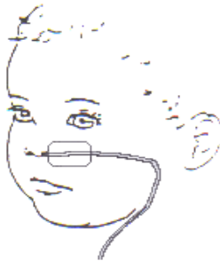
Afbeelding 2: Plakken van de sonde

De pleister wordt direct naast de neus geplakt, zodat uw kind de vingers er niet tussen kan krijgen om de sonde eruit te trekken.