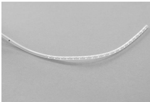
Afbeelding 1: Er zitten kleine gaatjes in de drain

Een drain is een dun plastic slangetje. In een deel ervan zitten kleine gaatjes (zie afbeelding 1). Via de kleine gaatjes wordt bloed en wondvocht afgevoerd.