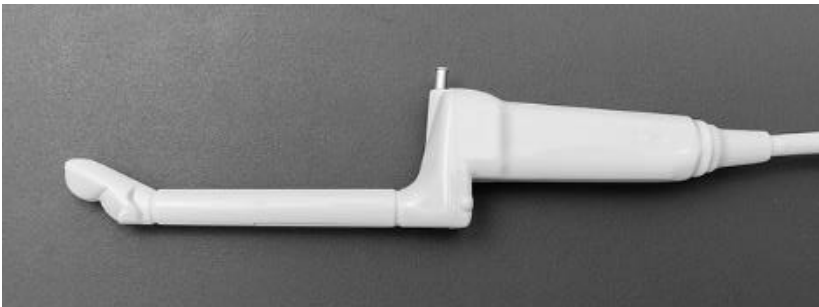
Afbeelding 2: het linkerdeel van de echosonde tot aan de eerste bocht

U wordt gevraagd de balzak omhoog te houden. Eerst wordt het perineum verdoofd met injecties, nadat er met een gaasje met desinfectans gedept is.