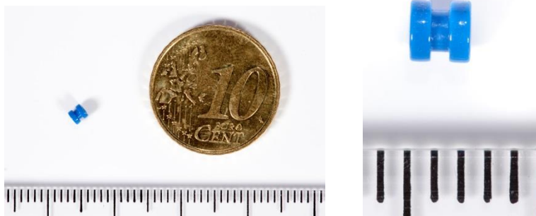
Afbeelding 3: Een trommelvliesbuisje

Er zijn verschillende typen trommelvliesbuisjes. Het trommelvliesbuisje valt er meestal na verloop van tijd vanzelf uit.