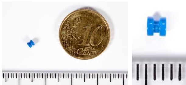
Afbeelding 3: Een trommelvliesbuisje

Er zijn verschillende typen trommelvliesbuisjes. De meest gebruikte blijft gemiddeld iets meer dan een jaar in het trommelvlies zitten. Daarna groeit het buisje er vanzelf uit.