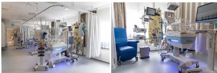
De afdeling Neonatologie.

Neonatologie betekent 'leer van de nieuwgeborenen'. Op de afdeling Neonatologie liggen baby's die extra zorg nodig hebben. Er wordt onderzoek gedaan naar eventuele aandoeningen en er wordt een behandeling gestart. De afdeling wordt High Care Neonatologie genoemd.